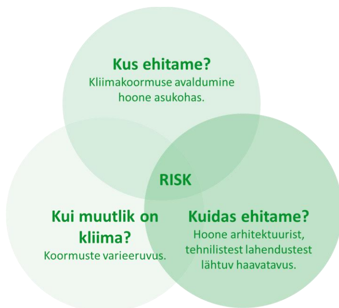
Joonis 2 Ehitatud keskkonna kliimarisiki kujunemine. Kliima muutlikkus on välismõju, mida saab mistahes ehitamisel ainult arvesse võtta, kuid kliimaohтусid juhtida ei saa. Renoveerimise puhul ei ole võimalik asukohta enam muuta, et rajada hoone kohta, kus kliimaohud vähem avalduks. Küll aga on võimalik muuta seda, kuidas ehitame, et hoone kliimaohutudele vastu peaks.

Risk kahju realiseerimisele sõltub avalduvast kliimakoormusest, nende väljendumisest asukohas ja hoone tehnilisest ja kasutajaspetsiifilisest haavatavusest. Võrreldes uute hoonetega on olemasolevad hooned raskemas olukorras (Joonis 2), kuna hoone asukohta (kuhu ehitada) ei saa muuta. Olemasolevad hooned on ka seetõttu haavatavamad, sest kliima mõju muutusega pole alati ehitamisel arvestatud.